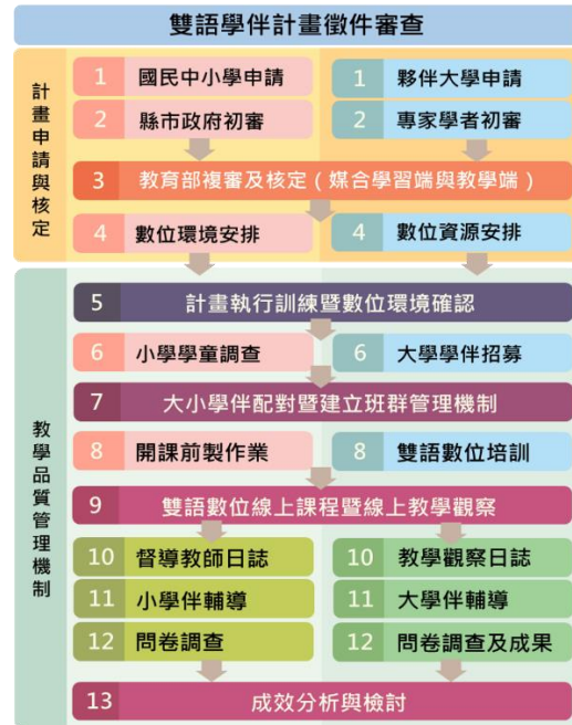
圖2 雙語學伴計畫實施流程